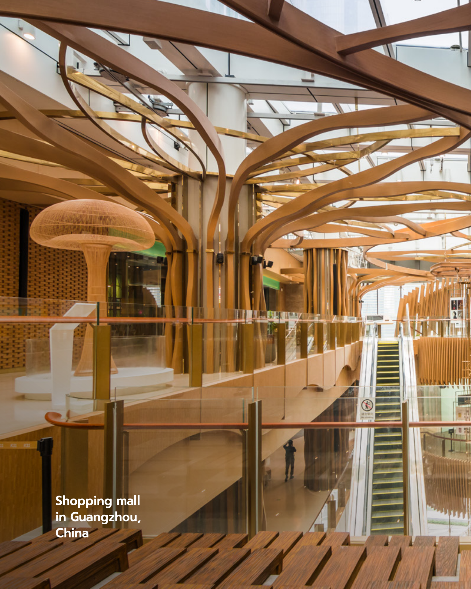
Shopping mall in Guangzhou, China